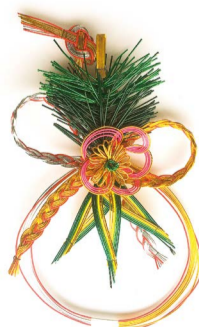
[名称] リボン付松竹梅