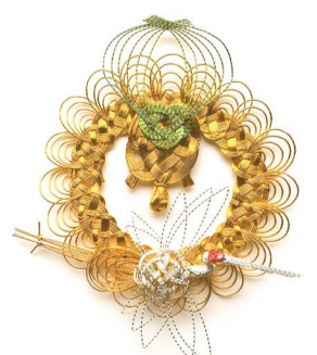
[名称] あわじ輪鶴亀