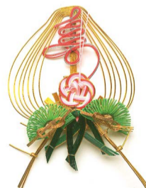
[名称] 松台寿松竹梅