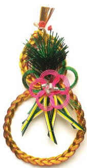
[名称] 瓢箪付松竹梅